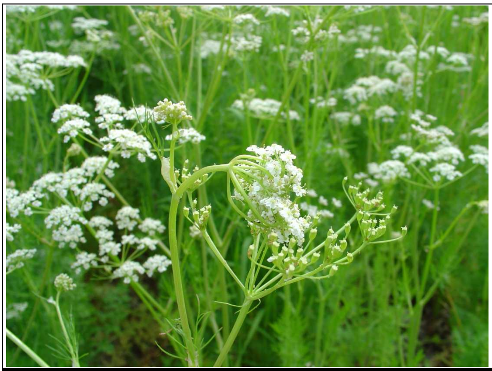
Obrázek č. 3: Typický projev plochušky kmínové ( Depressaria daucella ), která spřádá okolíky a okusuje květy a vyvíjející se nažky