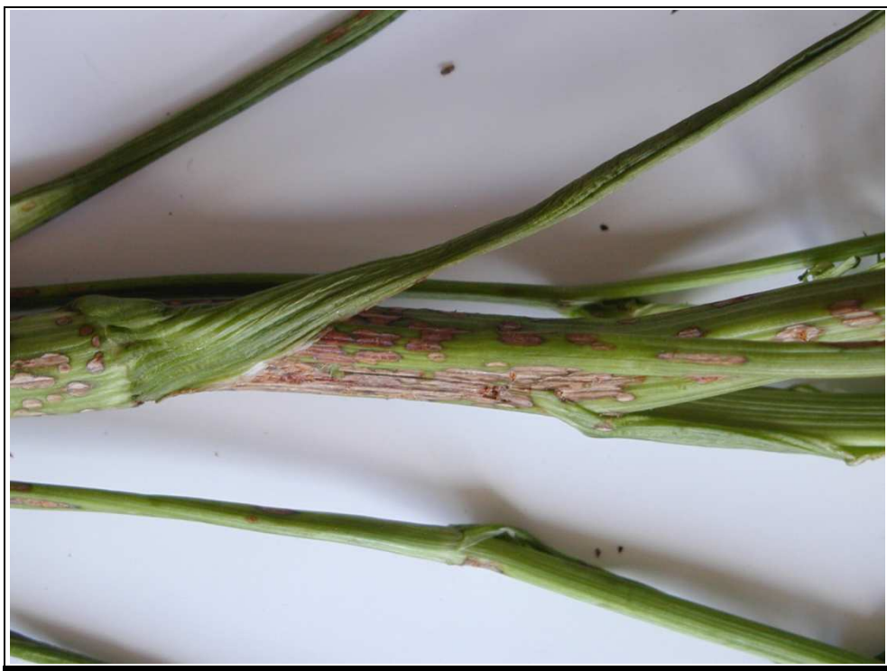
Obrázek č. 5: Ascochyta carvi