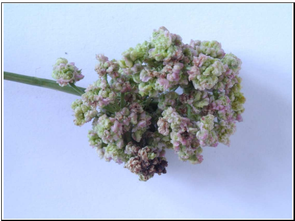
Obrázek č. 2: Okolík kmínu zdeformovaný tzv. květákovatěním, jehož příčinou je napadení vlnovníkem kmínovým