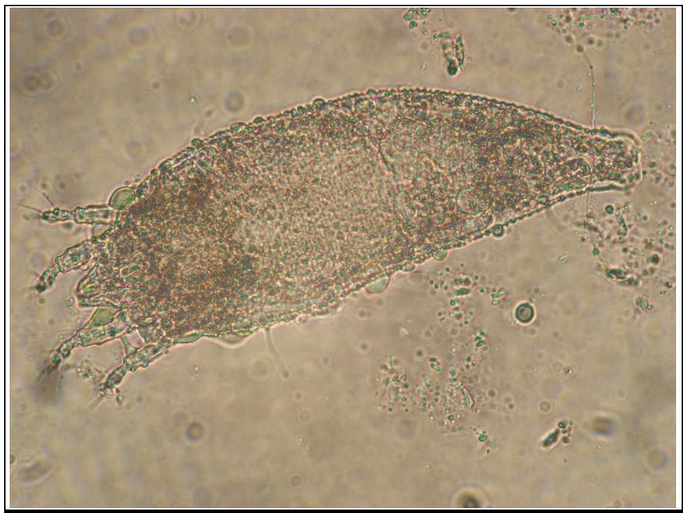
Obrázek č. 1: Vlnovník kmínový ( Aceria carvi ) – zvětšeno 200x