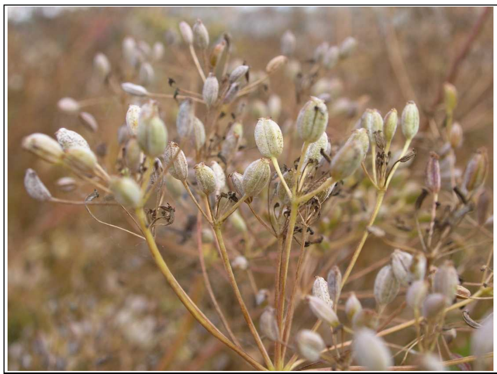
Obrázek č. 4: Erysiphe heraclei