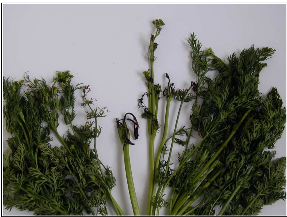
Obrázek č. 6: Bakteriální spála vegetačních vrcholů a květenství - původci Erwinia , Pseudomonas , Xanthomonas