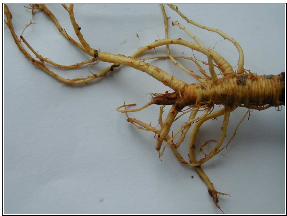
Obrázek č. 8: Rhizoctonia solani